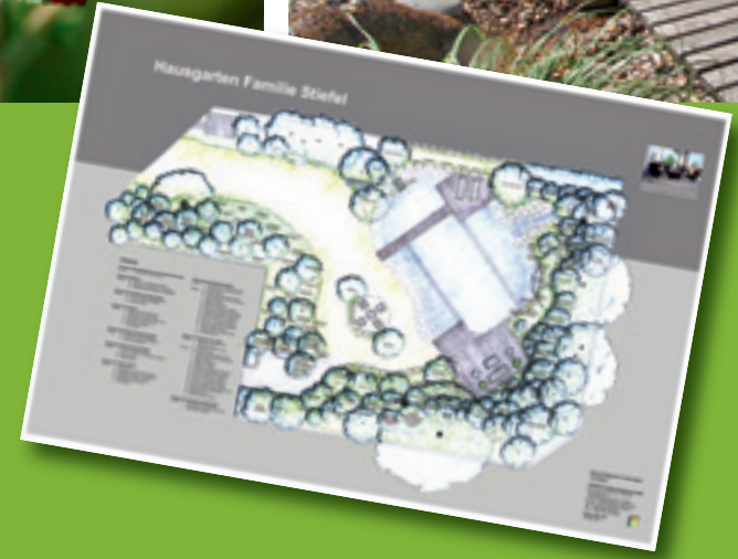
Unsere detailreich ausgestalteten Pläne veranschaulichen das individuell auf Sie zugeschnittene Konzept für Ihren Traumgarten.

Vereinbaren Sie einen Termin für eine individuelle Gartenberatung! Tel. 03327-5810-0